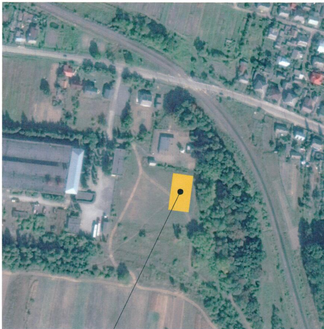
Облаштування спортивного стадіону по вул. Л.Ук в м. Жовква Львівської області